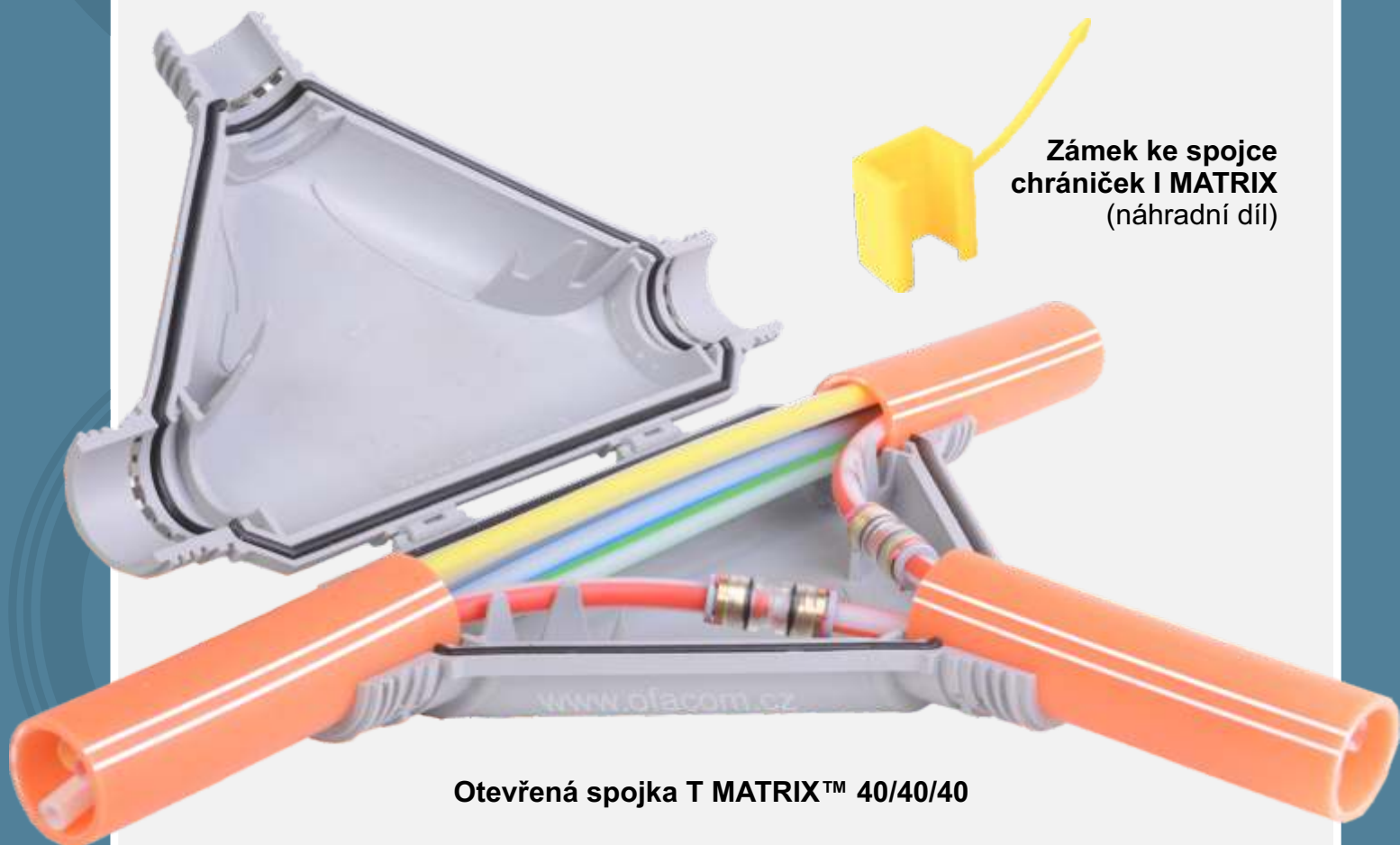
Zámek ke spojce chrániček I MATRIX (náhradní díl)