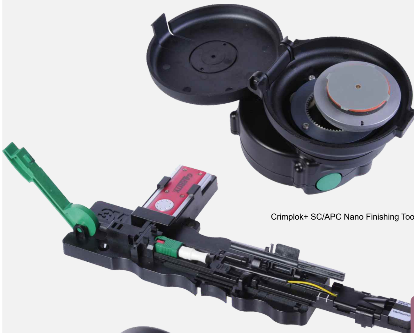
Crimplik+ SC/APC Nano Finishing Tool