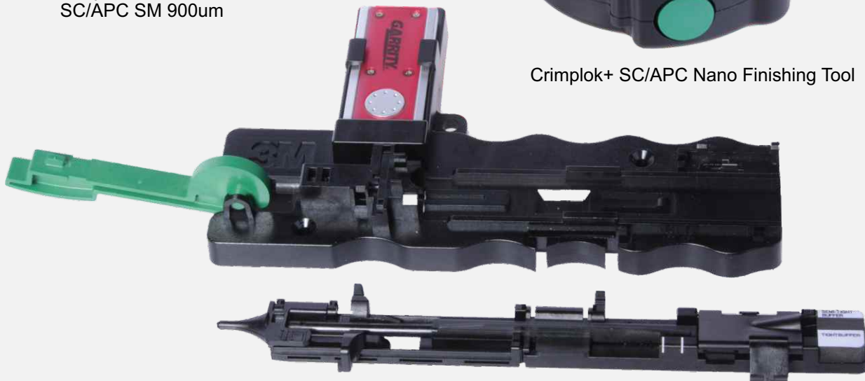
Crimplok+ SC/APC Protrusion Setting Tool