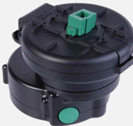
Crimplok+ SC/APC Nano Finishing Tool