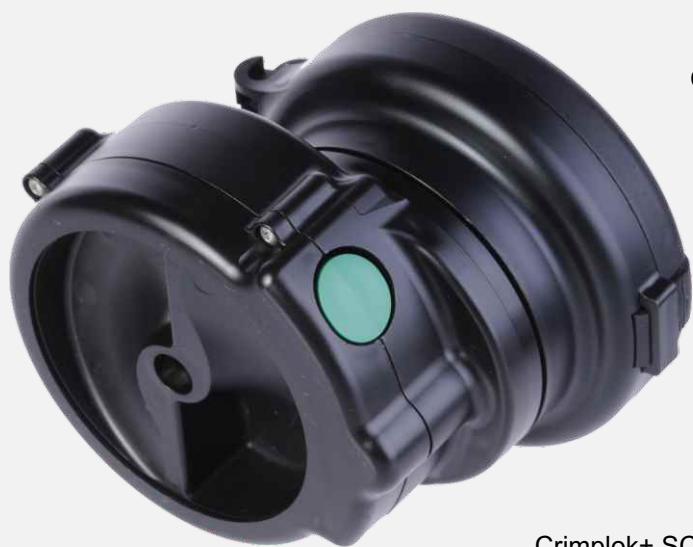
Crimplik+ SC/APC Nano Finishing Tool