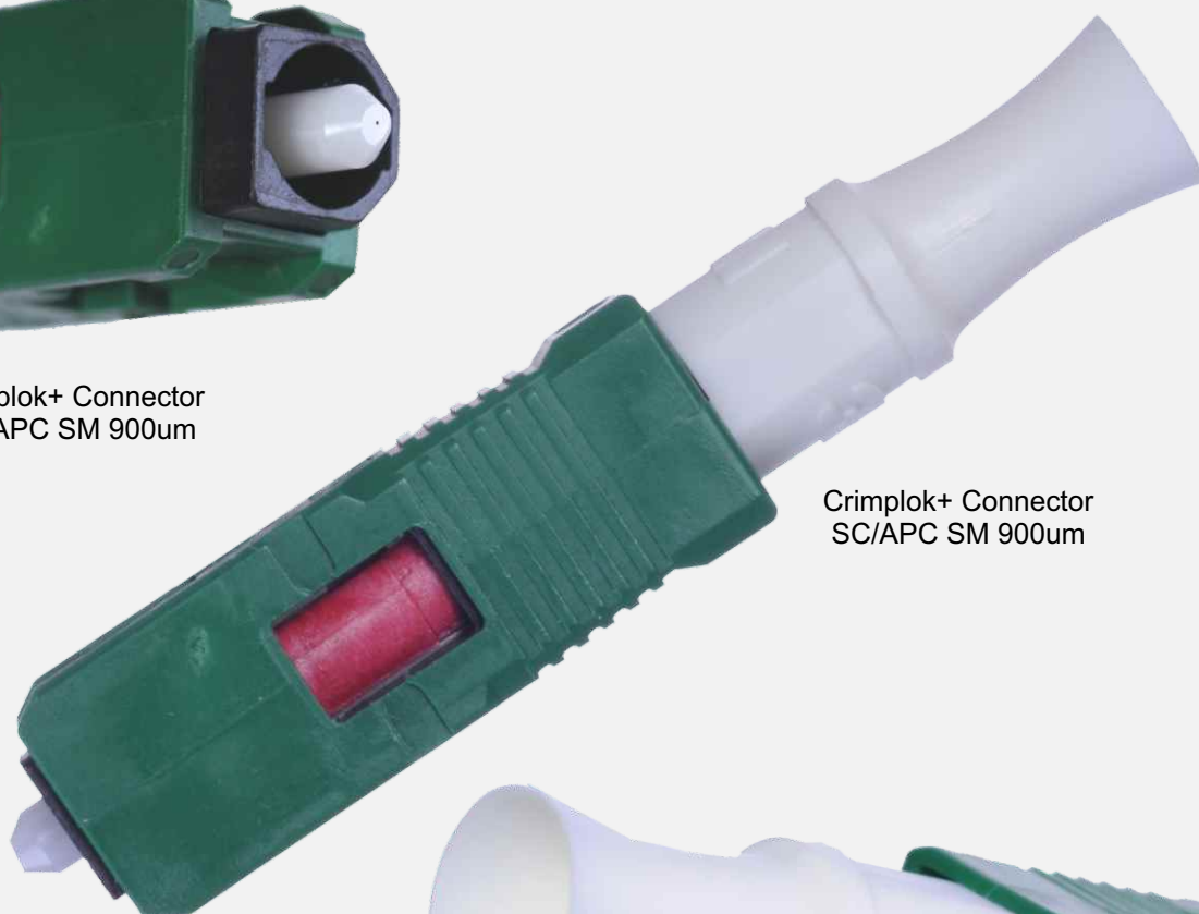
Crimplok+ Connector SC/APC SM 900um