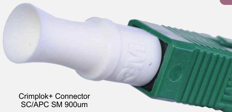
Crimplok+ Connector SC/APC SM 900um