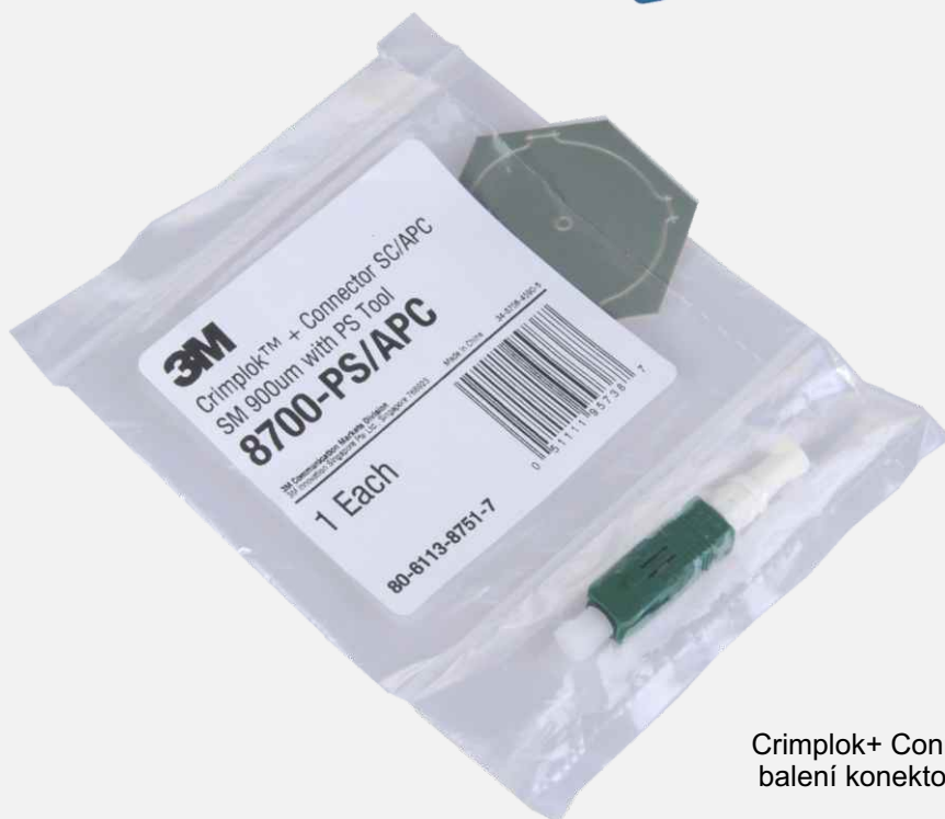
Crimplok+ Connector SC/APC SM 900um, balení konektoru v sadě s leštícím filmem