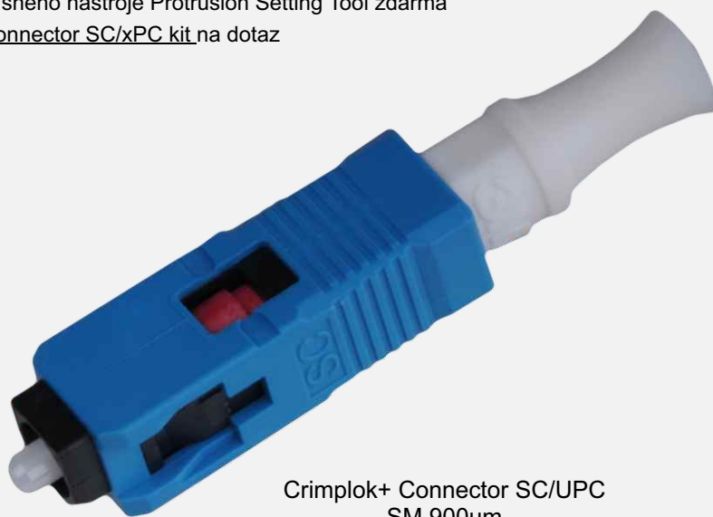
Crimplok+ Connector SC/UPC SM 900um

***) objednání sady 3M™ Crimplok™ + Connector SC/xPC kit na dotaz